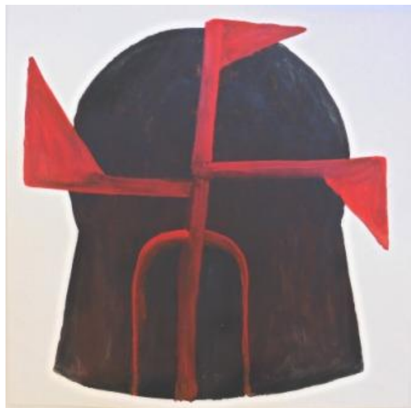
Aquarelle, 2014, 35x35 cm