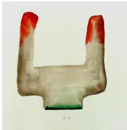
Aquarelle, 2014, 35x35 cm