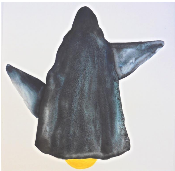
Aquarelle, 2014, 35x35 cm

" Mon travail cherche à créer des équivalences entre des gestes communs, des cultures rurales, des émotions physiques, des formes marquées par des archétypes culturels." - Extrait de l'entretien avec Anne Tronche, in catalogue "Etre tas", Editions du Centre culturel d'Issoire.