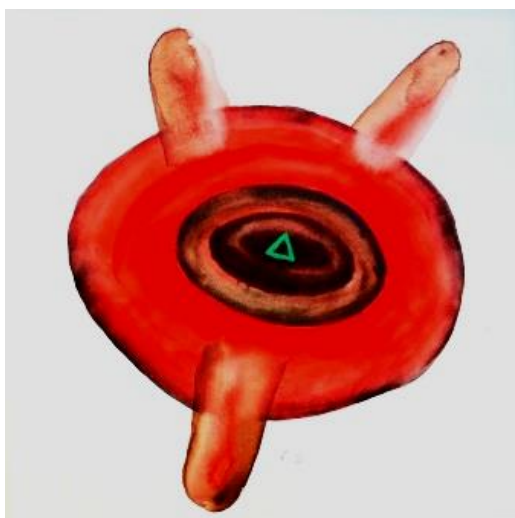
Aquarelle, 2014, 35x35 cm